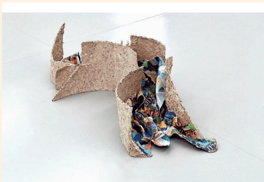
'Meander.' © LILI DUJOURIE