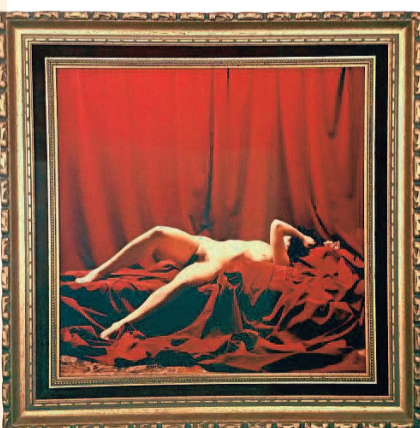
'Zonder titel (rood naakt)' © LILI DUJOURIE