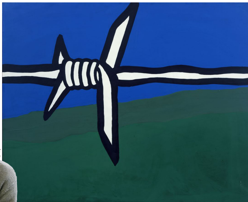
Gampelaere Omgeving (1967)

“Hij zal nooit vergeten worden. Zijn werk is uniek in zijn discretie, en het zal zeker zijn weg in de kunstgeschiedenis vinden. Het heeft die weg al gevonden, want zijn werk zit in de collecties van veel belangrijke musea. Hij is ook een absolute artist's artist : een kunstenaar die onder kunstenaars een ongelofelijke waardering geniet, omdat hij verschillende problemen heeft opgelost waar zij ook mee worstelen, en dat op een heel simpele en elegante manier. Wij hebben de tentoonstelling de titel oeuvre meegegeven, omdat het de bedoeling is om te tonen hoe