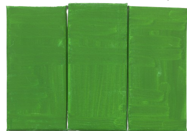
Green, Green, Green (2012)

Just omdat dat werk zo spartaans is en zo'n levenswijsheid uitstraalt. Raoul De Keyser was ook iemand die precies wist waar zijn invloed eindigde. Hij was niet iemand die de wereld wilde veranderen. Met ergens een beetje Vlaams is, niet? Hij hoefde de loop der dingen niet te breken. Gewoon een beetje buigen was al genoeg.”