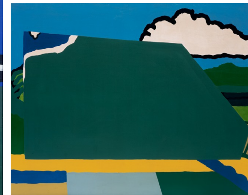
Hommage aan Brusselmans (1969-1970)

“Raoul De Keyser stond altijd stil bij de plek waarvoor hij nieuw werk maakte. Had hij een tentoonstelling in Berlijn of New York, dan dacht hij daar over na. Zo had hij ooit ook een expo in Tokio. Verder weg van zijn woonplaats Deinze kan bijna niet. Toen hij aan die tentoonstelling werkte, heeft hij de boom geschilderd die hij altijd voor zijn ei-