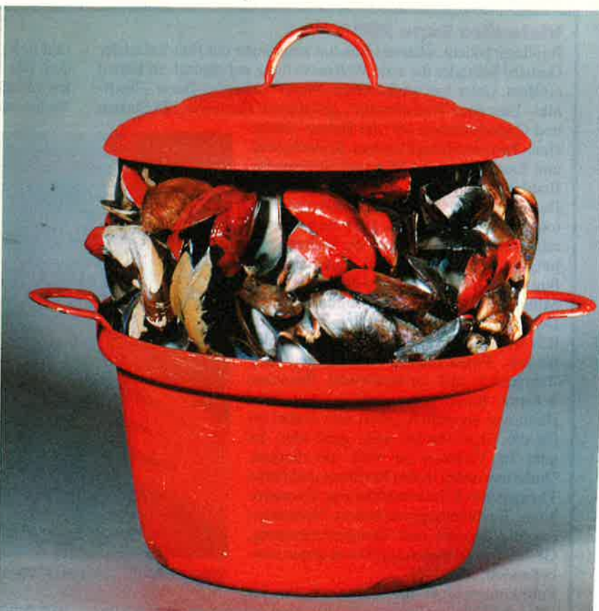
KMSK VAN BELGIË/SABAM