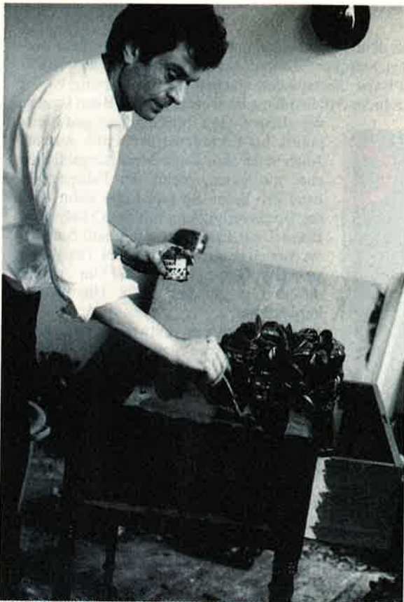
MARIA GILISSEN/ESTATE MARCEL BROODTHAERS