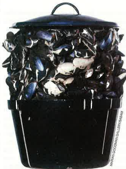
MOULES SAUCE BLANCHE. 1967. De meest poëtische van allemaal!

De Grande casserole de moules is de grootste van de acht mosselpotten die Broodthaers maakte (65x75x70 cm). Net