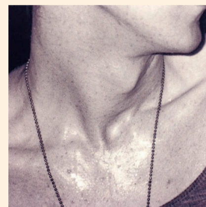
Beeld van Wolfgang Tillmans.

De expo 'The Photographic' in het S.M.A.K. in Gent voert in een eerste luik een 20-tal fotografen op die spelen met de grenzen van hun medium en die voortdurend de verhouding tussen de camera en het object exploreren. Het resultaat zijn aangrijpende beelden die de fotografie als het ware heruitvinden.