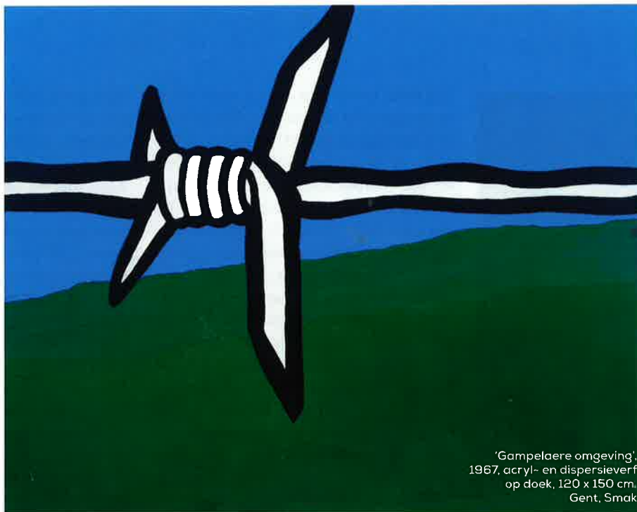
'Gampelaere omgeving', 1967, acryl- en dispersieverf op doek, 120 x 150 cm. Gent, Smak

Gent toont een overzicht van het werk van de schilderende sportverslaggever Raoul De Keyser . Die zocht zijn onderwerpen dicht bij huis: voetbalveld, prikkeldraad, tent.