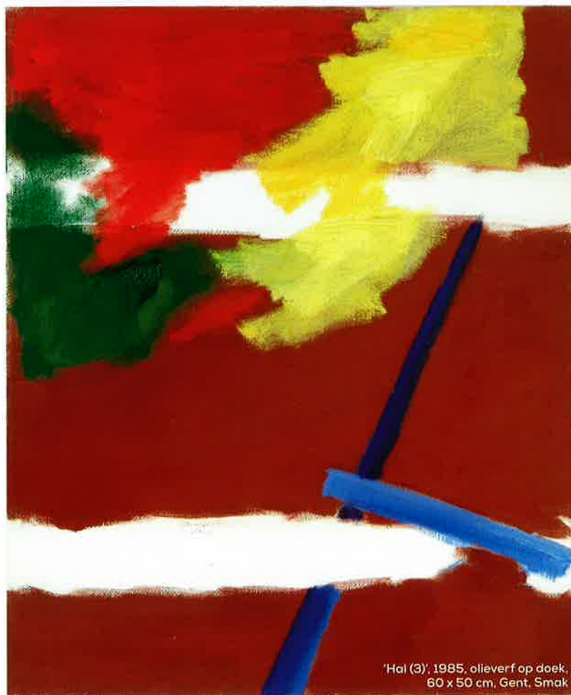
'Hal (3)', 1985, olieverf op doek, 60 x 50 cm, Gent, Smak