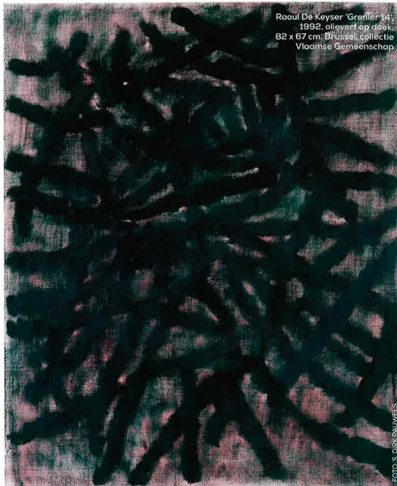
Raoul De Keyser 'Gravier 14', 1992, olieverf op doek, 82 x 67 cm, Brussel, collectie Vlaamse Gemeenschap

'Raoul de Keyser, Oeuvre'. 22 september t/m 27 januari, Smak, Jan Hoetplein 1, Gent; di t/m vr 9.30-27.30, za en zo 10-18; toegang € 8,00; catalogus ca. € 40,00 (eigen uitgave i.s.m. Pinakothek der Moderne, München, Buchhandlung Walther Koenig en Mercatorfonds); smak.be