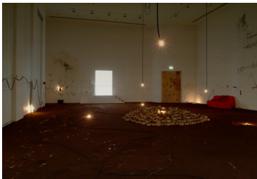
'Interminável', installatie van Artur Barrio.

De ruimtevullende installatie Interminável ('eindeeloos') was eerder in het Smak te zien in 2005, in een tentoonstelling die zijn werk koppelde aan dat van Joseph Beuys. Net als de Duitse sjamaan gebruikte Barrio vergankelijke materialen met een symbolische lading. De verduis-