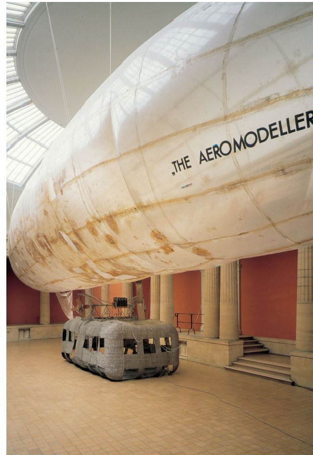
Panamarenko's pronkstuk in het halfrond van het MSK.

ur Barrio grijpt met zijn kunst naar een nultoestand, naar de essentie. Daarbij stelt hij onze obsessie met het immateriële aan de kaak, het bewaren en behouden van dingen. Voor een museum dat zijn werk aankoopt, zoals het Smak deed, vormt dit een uitdaging. Hoe het vasthouden, documenteren, reconstrueren? Er bestaat al een schriftje van met aantekeningen. Voor de tentoonstelling komt Barrio Interminável opnieuw installeren, maar dan als een nieuw hoofdstuk. De broden en de koffie liggen al klaar.'