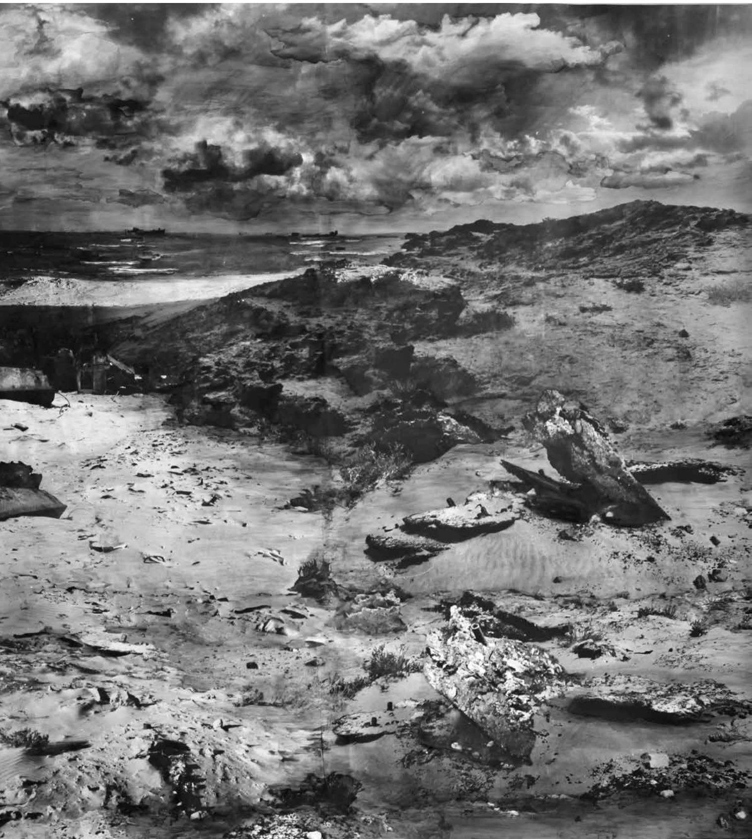
Marie Cloquet Nouadhibou III , 2010, fotografische emulsie en aquarelverf op papier Vrienden v/h S.M.A.K., 2014 bruikleen