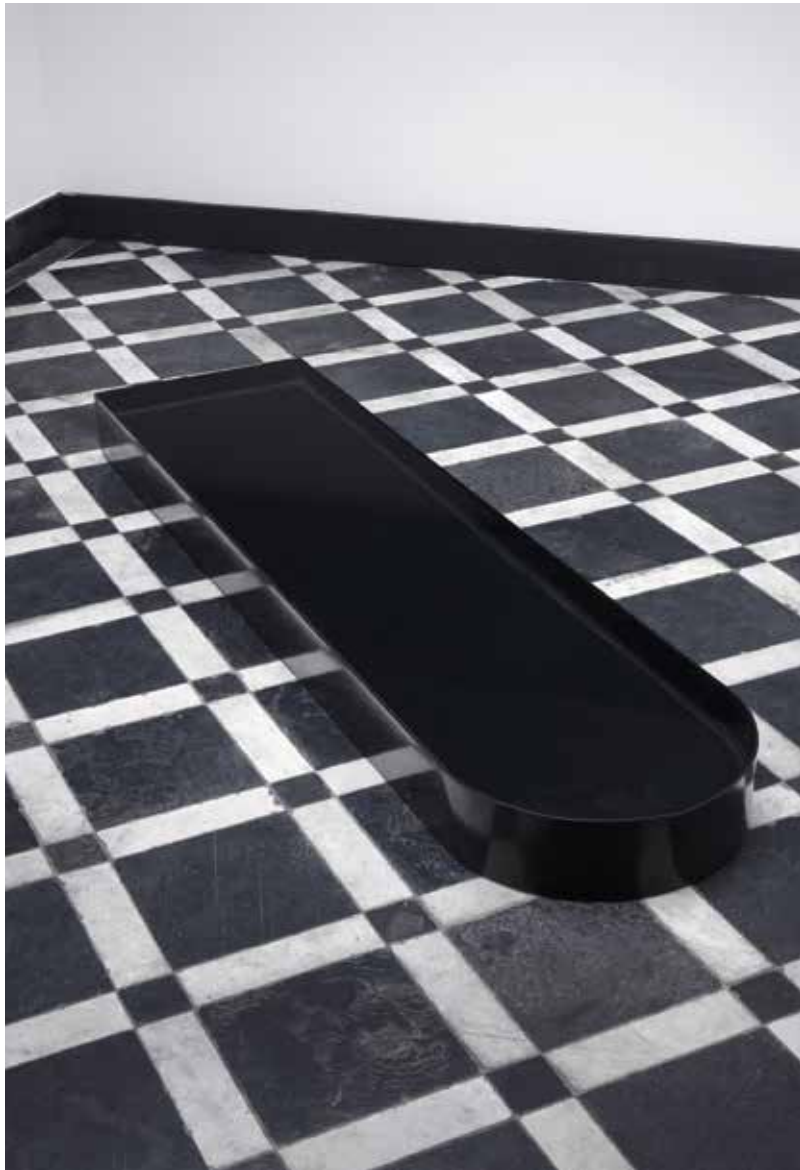
SomePlace#1, 2014 Metaal, water