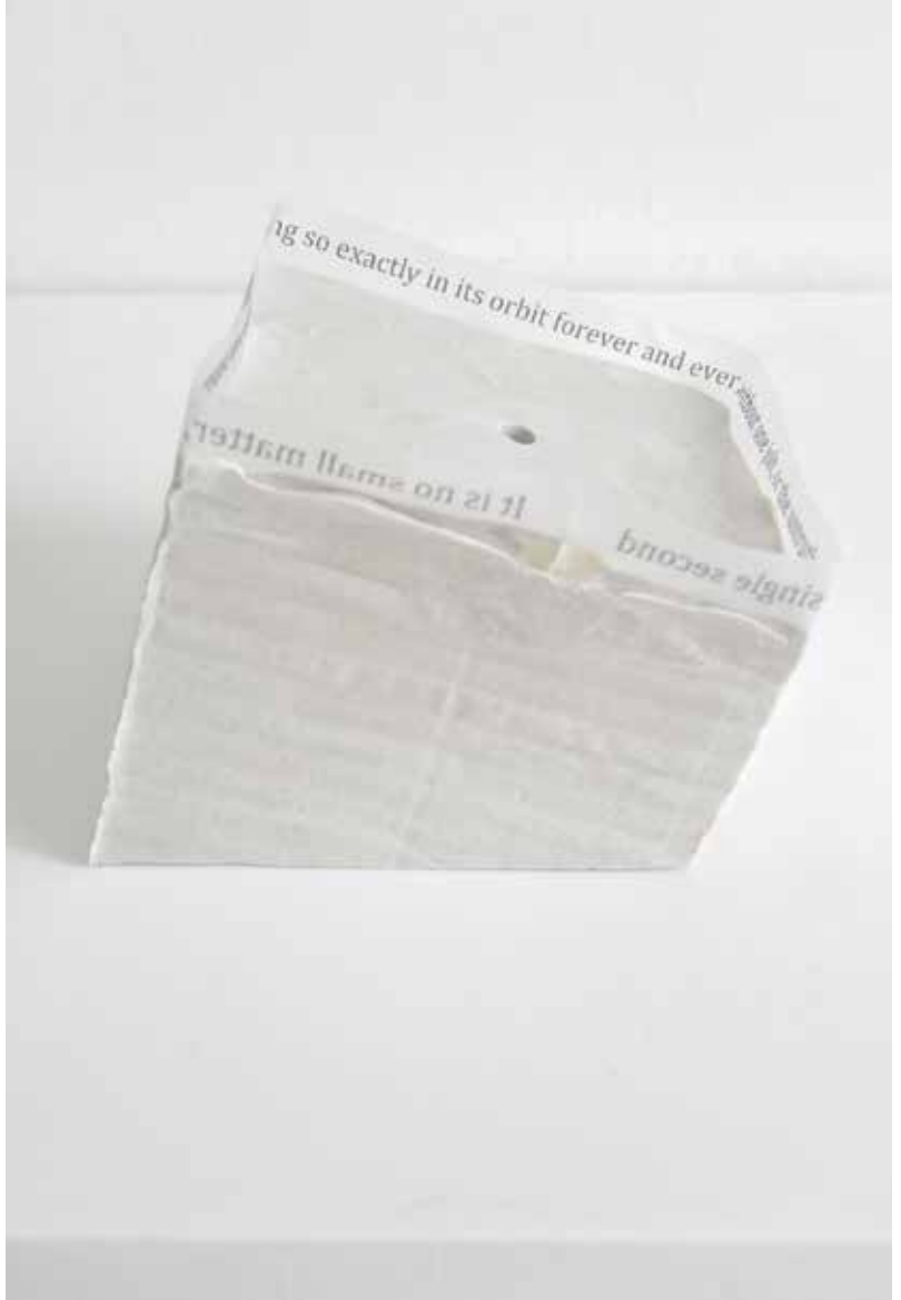
It is no small matter (from Rudiments series ), 2016 Gips, kalkpapier