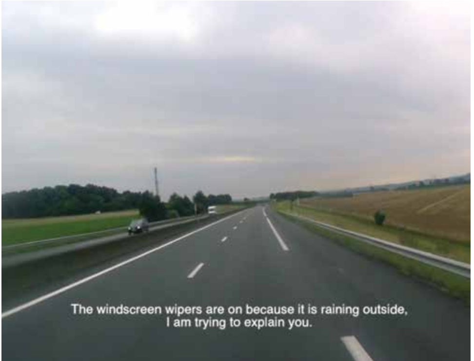
On the Road , 2015 HD video, still, 37'00"