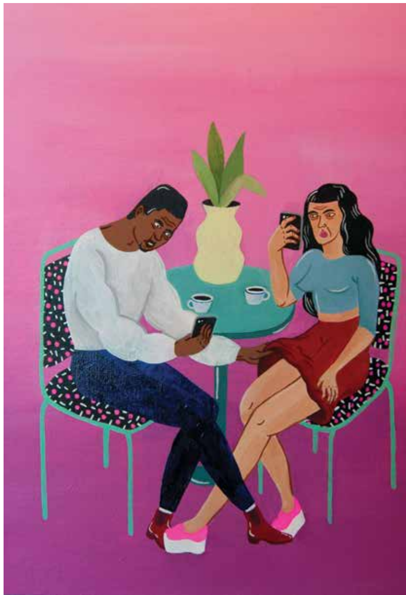
Sneaky Coffee , 2016 Acryl, gouache op paneel