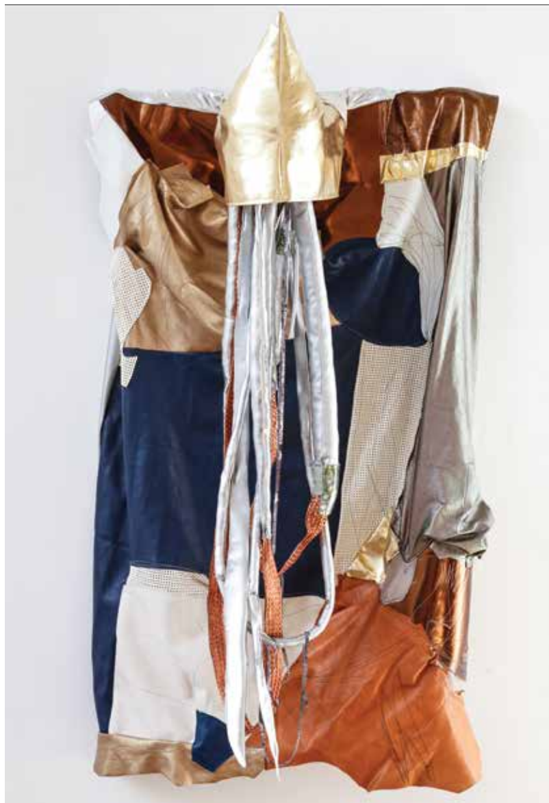
Escaped From My Mantle For Tonic, 2016 Zijdedraad, leer, kunstleer, koper, piepschuim, vossenkraag