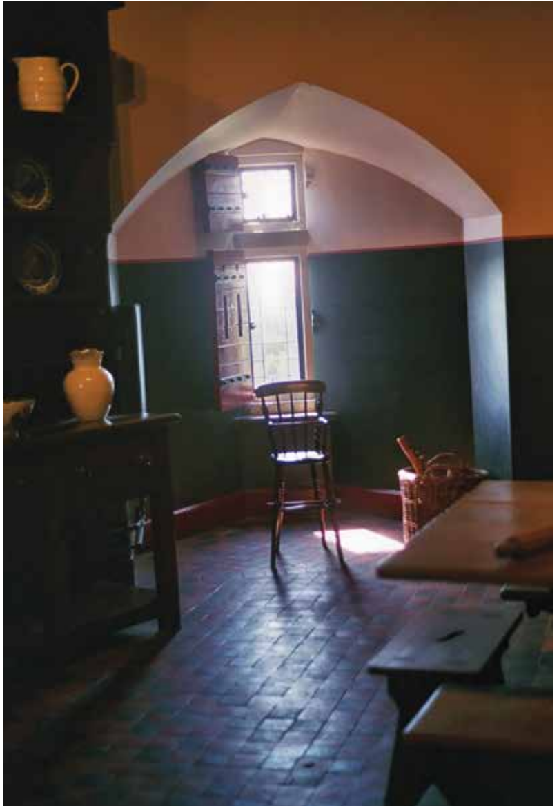
Re-enacted kitchen in Castell Coch, 2016 C-print