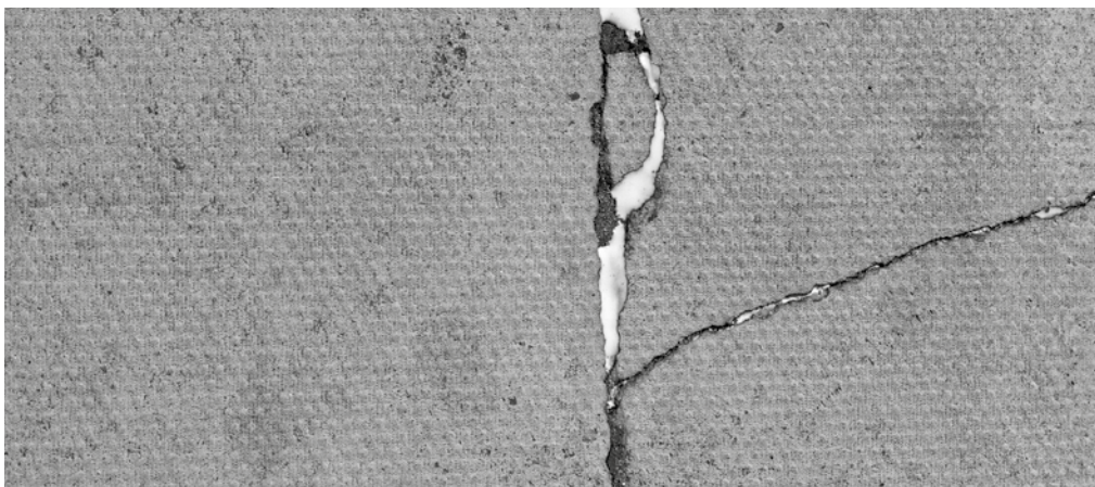
© Maria Laet, Milk on pavement , 2008 (detail)

Waar liggen de raaklijnen tussen heden en verleden, tussen ik en de medemens, tussen natuur en cultuur? Het MSK nodigt negen hedendaagse kunstenaars uit om in het museum te werken rond die grijze zone, waar grenzen vervagen en alternatieve zienswijzen ontstaan. Samen met ons formuleren ze een nieuwe visie op de wereld, vertrekkend vanuit het lokale.