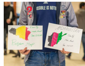
'Traces of Survival' Biënnale Venetië 2015 & boek

haar werk, dat toen met bijna 90.000 bezoekers onze best bezochte expo ooit werd." "Hedendaagse kunst heeft vaak een cerebraal en afstandelijk karakter, en dan is het fantastisch om te zien dat een kunstenaar zo veel mensen kan beïnvloeden. Haar oeuvre is als een soort spiegel waar we in deze tijden van crisis vaker in zouden moeten kunnen kijken."