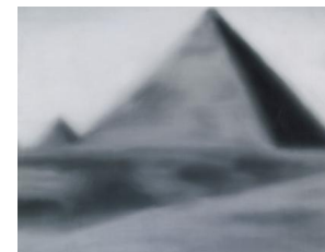
Gerhard Richter Oktober 2017 - februari 2018