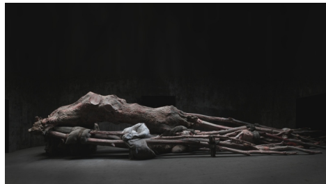
'Kreupelhout' van Berlinde De Bruyckere Belgisch Paviljoen Venetië 2013 & expo oktober 2014 - februari 2015