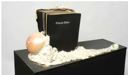
'Pense-Bête' van Marcel Broodthaers Aankoop in 2006