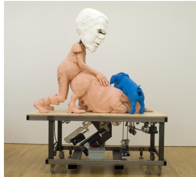
Paul McCarthy Oktober 2007 - februari 2008