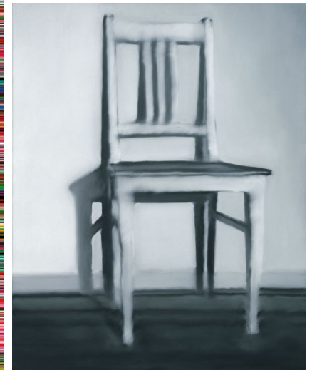
'Küchenstuhl', 1965. © Kunsthalle Recklinghausen

Richter is gefascineerd door perceptie en trekt zich van de tegenstelling tussen figuratief en abstract niets aan