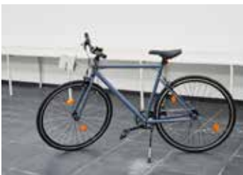
10. Untouched Marble , 2014 ( Onaangeroerd marmer )