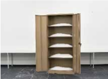
12. A Mixed Up Dream #3 , 2016 ( Een verwarde droom #3 )

Watermeloenpitten rusten in een holte in een betonnen blok, een organische vorm verkregen door de afdruk van de vrucht waarvan de pitten afkomstig zijn. De pitten overleefden de afwezigheid van de vrucht en zouden kunnen ontkiemen, waardoor de oorspronkelijke vorm van dit kunstwerk zou worden gereconstrueerd. De holte, ontstaan onder het gewicht van de vrucht, bevat de essentie van de vrucht zelf.