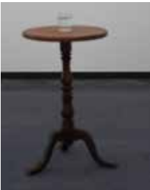
19. DRINK EUROPA , 2013 ( Drink Europa )

glas, 27 Europese mineraalwaters, bijzettafel