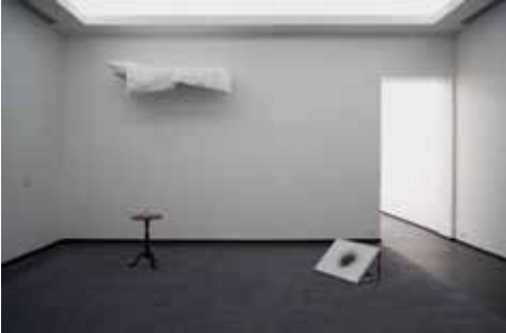
18. I Guess That Dreams Are Always There , 2014 ( Ik denk dat dromen er altijd zijn )

maracujá (passievrucht), elektrische oplader