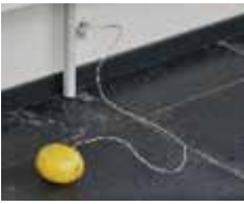
17. Reloading Passion , 2011 ( Passie herladen )

maracujá (passievrucht), elektrische oplader