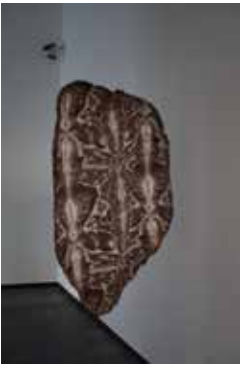
33. Night Cartography #2 , 2017 ( Nachtcartografie #2 )