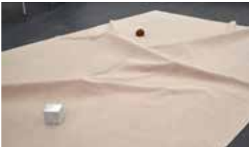
9b. Geography & Abstraction , S.M.A.K., 2017-'20 ( Geografie & Abstractie , S.M.A.K.)

Was van votiefkaarsen (gestolen uit een kerk in de Libanese heuvels) werd gegoten op een slaapmasker dat meerdere maanden door de kunstenaar is gebruikt.