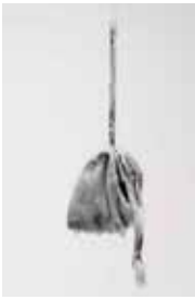
9a Night Cartography #3 , 2016-'19 ( Nachtcartografie #3 )

vliegtuigslaapmasker, was van votiefkaarsen, dromen, wensen lopende reeks