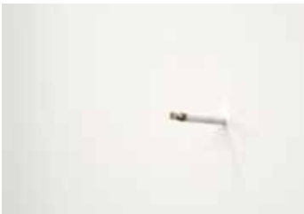
13. Parler à un mur , 2011 ( Praten tegen een muur )

'A Mixed Up Dream #3' maakt samen met 'Dream Salt' en 'A Mixed Up Dream #1' deel uit van een serie werken die in 2016 begon. Lees meer informatie bij 'Dream Salt' (nr. 4 in deze gids).