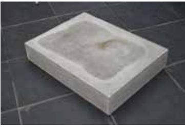
11. Life, Variation #2 , 2019-'20 ( Leven, Variatie #2 )