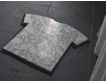
34. Divine , 2019 ( Goddelijk )

Voor 'Night Cartography #2' bedekte de kunstenaar zich gedurende één nacht met dit deken. Het deken werd achteraf traag en op een delicate manier verbrand, waardoor het veranderde in een rond territorium, een gat om dromen te vangen.