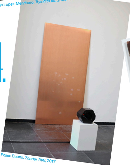
Pollen Boons, Zonder Titel, 2017