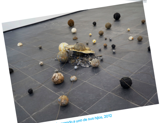
Ricardo Brey, Saturno devorando a uno de sus hijos, 2012