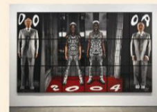
'Root' van en met Gilbert & George.

'Together Collaborative Art Practices' loopt tot 8 september in het S.M.A.K. in Gent.