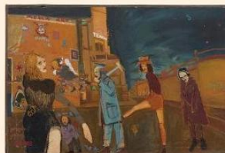
'We were all together in Barcelona'.