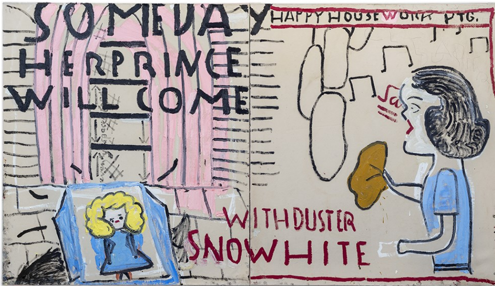
<p>Sneeuwwitje met stofvod: commentaar op het vrouwbeeld. <span class="credit">Rose Wylie</span></p>

Sneeuwwitje met stofvod: commentaar op het vrouwbeeld. © Rose Wylie