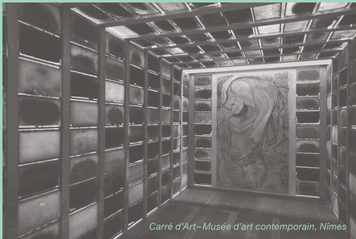
Carré d'Art–Musée d'art contemporain, Nîmes