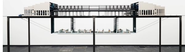
Onder de hal komt zes meter onder de grond een depot.

ARCHITECTUUR Een ongevraagde maquette stimuleert de fantasie over hoe het Smak er in de toekomst kan uitzien. De Floralienhal krijgt een kop en een staart en een ondergronds depot. Zo simpel kan het zijn.