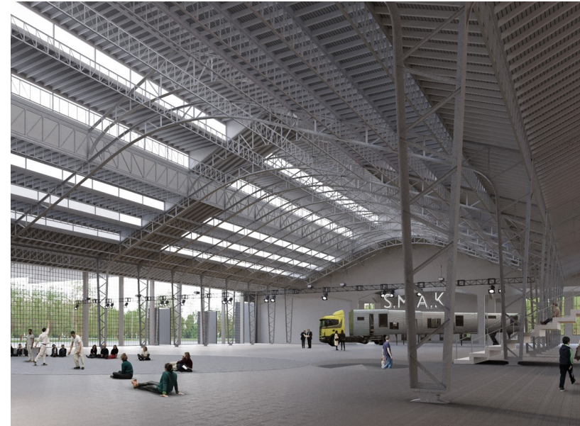
De Floralienhal wordt een 'witruiimte' voor de stad. © Dirk Pauwels

Mogelijk heeft zijn dwarsdenken hem de wedstrijd gekost. Toen de jury hem vroeg of hij zijn ideeën