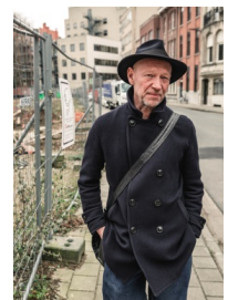
Luk Perceval.

Voor de eigen producties verwacht NTGent pas publiek te kunnen verwelkomen in de zalen vanaf 1 april. Als de coronamaatregelen kunnen Twitter een nieuw, ruimer publiek bezorgen. Critici zullen mopperen dat Twitter dan niet echt meer Twitter is. En dat klopt. Maar hetzelfde blijven, is geen optie.