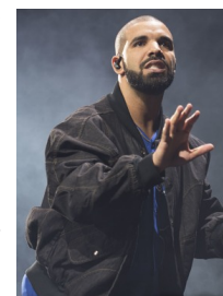
Drake is boos.

Lemonade van Beyoncé verloor in 2017 van Adele's 25, dat uitkwam in november 2015. De Grammy's bekronen platen die tussen 1 oktober