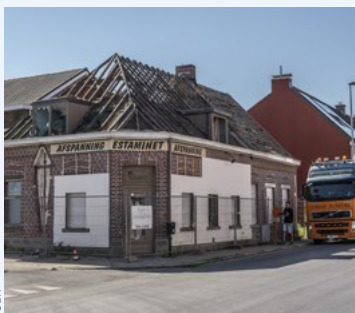
■ Het voormalige jeugdhuis gaat helemaal tegen de vlakte.

Het huidige jeugdhuis wordt helemaal afgebroken. Enkel een kruisbeeld werd voor de werken weggenomen en krijgt straks een nieuwe plaats op de